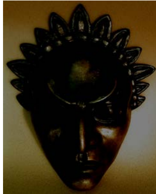
Chef de la tribu des brasiers "Les chemins invisibles" - Québec 2007

Mercredi 24 mai 2018 , à partir de 14h00 Atelier de Marie Muyard 5445, avenue de Gaspé # 501 - Montréal