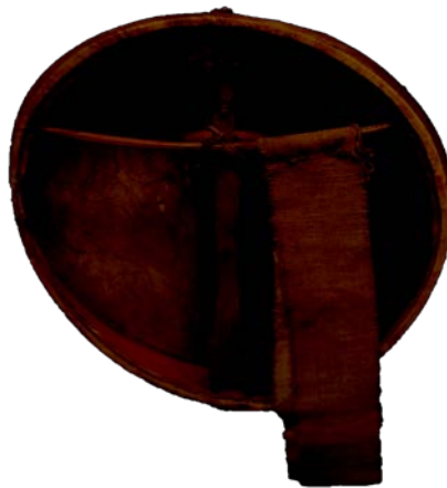
Figurine anthropomorphe d'esprit - Altaï - Sibérie méridionale

Les ressources conjointes de deux traditions millénaires, la pratique de l'autolouange et la sagesse des contes de fées (*), seront notre source d'inspiration pour créer une alliance vivante avec la quintessence de nous-même et la révéler au grand jour.